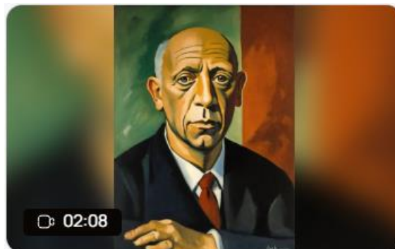
Pablo Picasso Created Apr 9, 2024