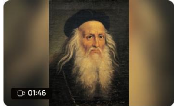
Leonardo da Vinci Created Apr 10, 2024