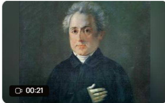
Διονύσιος Σολωμός Created Aug 29, 2024

Το D-ID είναι ένα από τα πρώτα προγράμματα T.N. για ομιλούσα φωτογραφία αλλά και avatar.