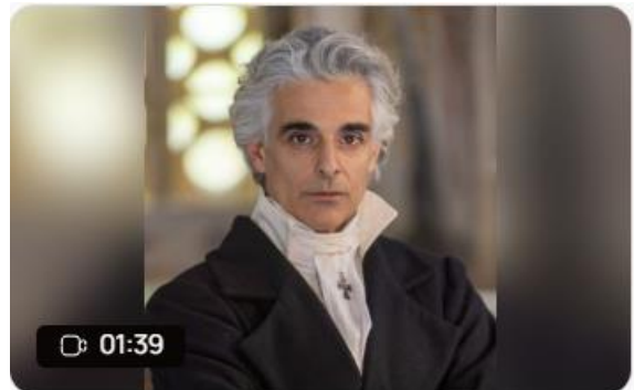
Ιωάννης Καποδίστριας Created Apr 3, 2024

Τα Video που δημιουργούνται μ' αυτόν τον τρόπο μπορούν να παρουσιαστούν μόνα τους ή να μπουν σε μια παρουσίαση του Powerpoint ή του Canva.